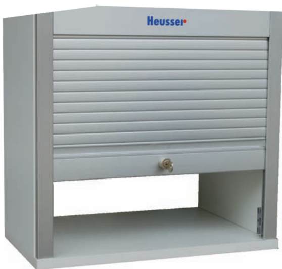
Anwendungsbeispiel Exemple d'emploi